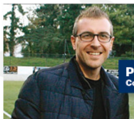
Par Frédéric ANNIN Correspondant sportif