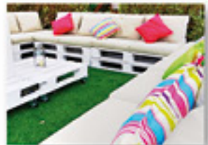
Espace Lounge Extérieur