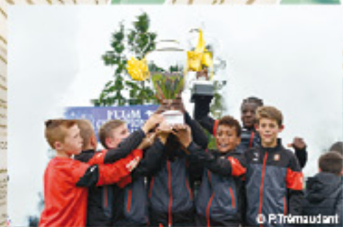
Le Stade Rennais FC est le tenant du titre et le détenteur du plus grand nombre de victoires (4)